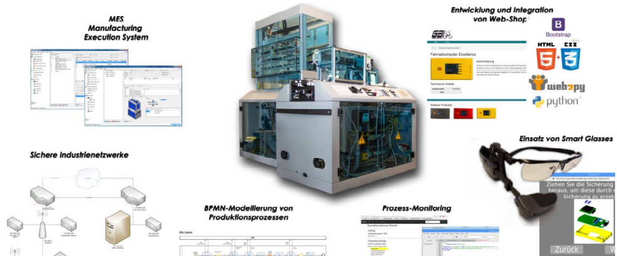
Abbildung 2: Projekte der Excellence Initiative 2017 (Überblick)